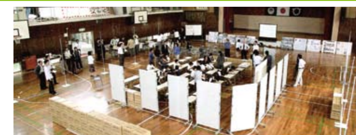
体育館で行うワークショップの例

ご興味をお持ちの方は、どなたでも参加出来ます！ 参加を希望する方は下記の連絡先に〔氏名、連絡先、所属〕をご連絡ください。みなさまの参加をお待ちしています。