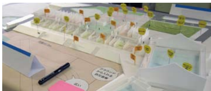
グループワークでは新校舎の特徴を印した模型を使用しました