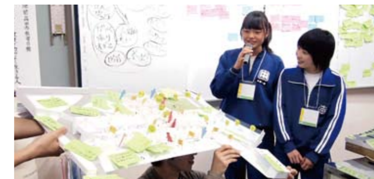
模型を使用してグループワークのまとめを発表する中学生

グループワークで議論した意見のまとめを各グループ代表者が参加者全員の前で発表しました。大人グループでは、地域開放時の図書館やパソコン室の利用方法や図書館の運営に関する事、学校と地域施設のセキリティの区切り方など様々な意見が発表されました。中学生グループでは、部活動に関係する使い方や、卒業しても訪れたいような場所が欲しいと、模型を使って発表していました。