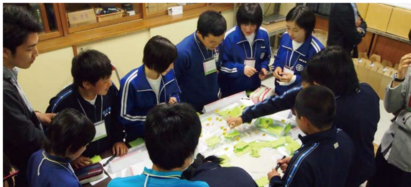
中学生のグループワーク風景。模型を囲んで議論。

先日、2回目となる高田東中学校新校舎の学校づくりワークショップが開催されました！ 今回は『生徒も地域も学べる中学校』というテーマで新校舎の具体的な使い方を一緒に考えました。