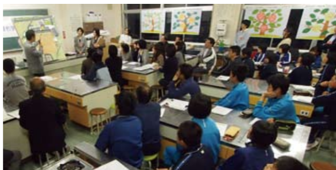
前回ワークショップをふまえた計画案を説明。参加者は46人。

3月15日に行われた第1回学校づくりワークショップでは「地域に開かれた中学校」というテーマで新校舎の使い方について議論しました。第1回ワークショップでの意見をふまえ、具体的にになった設計案を報告。「統合した3中学校の歴史を展示出来る場所」や「色々な方向から入れる駐車場」など、みなさんのワークショップや希望の木の意見が新校舎の計画に取入れられています。